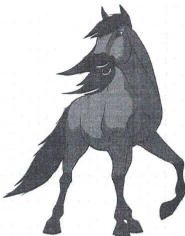
Порядок в избе